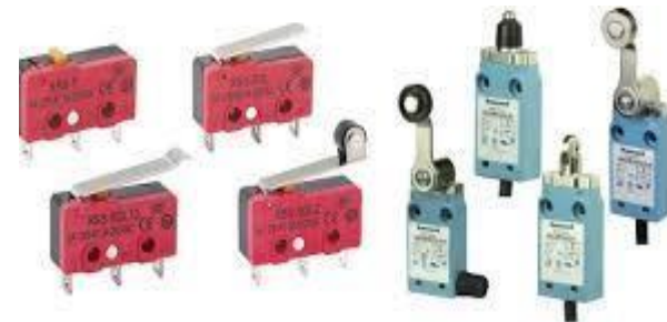
MICROINTERRUPTORES Y FINALES DE CARRERA " FUNCIONAMIENTO Y POSIBLES USOS "