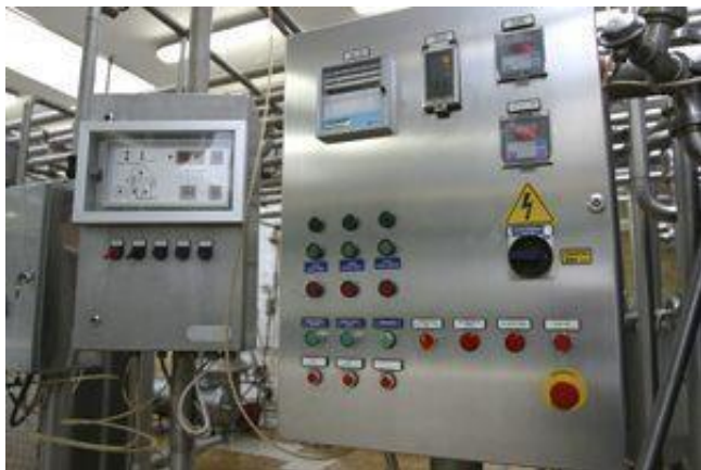
Esta foto de Autor desconocido está bajo licencia CC BY-SA-NC